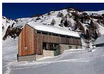
BOVARINA 1870 m