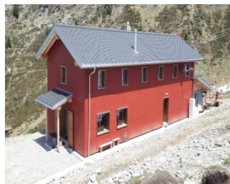
GESERO 2000 m